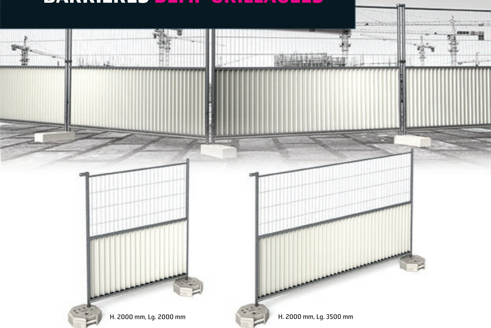
H. 2000 mm, Lg. 2000 mm