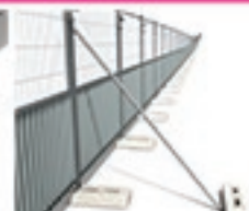
Jambe de force à lester