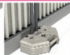
Plot résine octogonal 26Kg