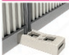
Plot béton 36Kg