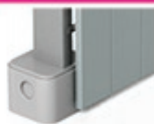
Plot béton amovible