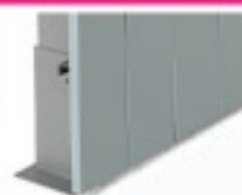
Platine à cheviller