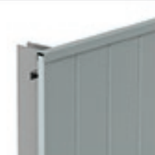
U de coiffe