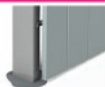
Plot béton à couler